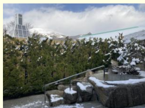
バックには雄大な雪化粧の伊吹山(大浴場)