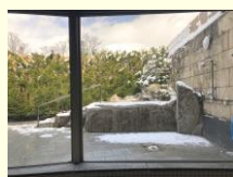
内湯の淵に腰掛けて窓から露天風呂を眺める(大浴場)