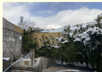
露天風呂入口から眺める伊吹山も絶景(小浴場)